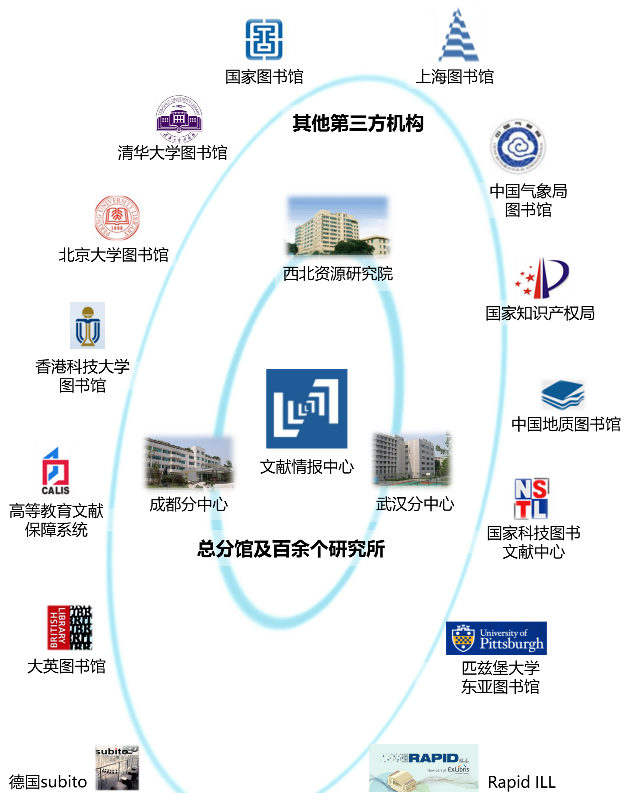
以上文献资源数据统计截至2022年